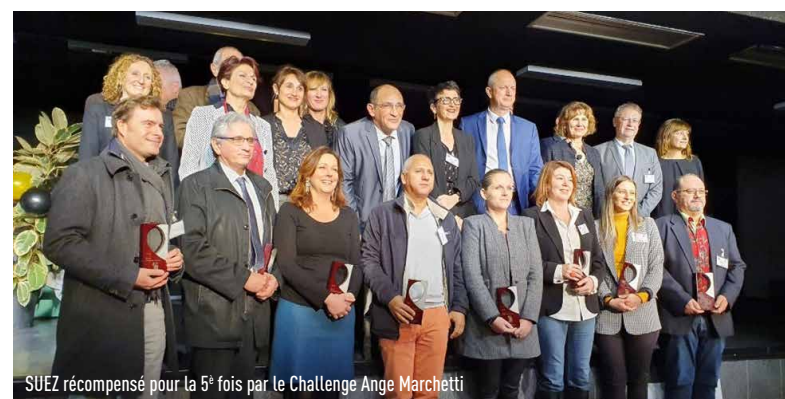
SUEZ récompensé pour la 5 e fois par le Challenge Ange Marchetti

SUEZ est depuis huit ans partenaire du Challenge Ange Marchetti, porté par la Maison de l'emploi Ouest Provence. Ce challenge vise à récompenser les entreprises engagées dans des actions sociales pour l'égalité homme femme. D'autre part, SUEZ participe également au dispositif Qualijob avec le pôle de formation de l'Union des Industries et Métiers de la Métallurgie (UIMM) à Istres. Ce dispositif tend à faciliter l'insertion sociale des femmes dans des métiers de l'industrie.